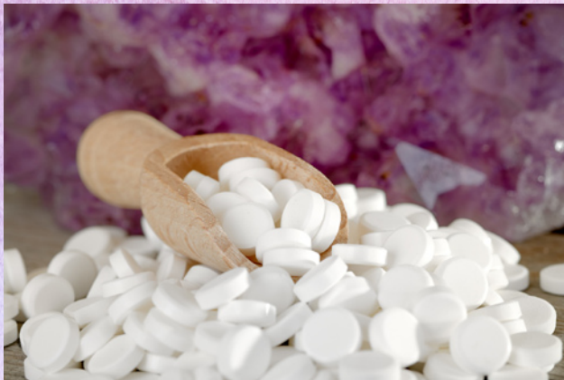
Schüßlersalz und Mineralstein

„Schüßler gelangte zu der festen Überzeugung, dass fehlende Mineralsalze in den Zellen des lebenden Organismus Krankheiten hervorrufen können.“